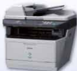
Aculaser MX20DN Láser multifunción monocromo a 28ppm