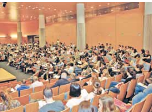
Salón de Actos de la Ciudad de La Justicia