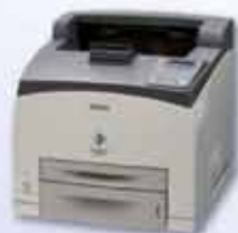
Aculaser M4000N Láser monocromo a 43ppm