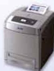
Aculaser C3800N Láser color a 25/20 ppm