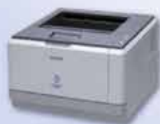
Aculaser M2000DN Láser monocromo a 28ppm dúplex