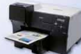
B-510DN Business Inkjet con dúplex