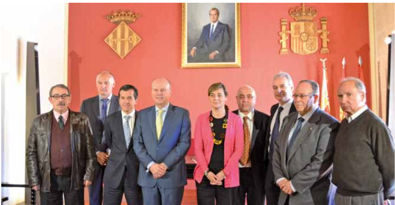
Acto de inauguración del SMAC de Alzira

Sería demasiado triunfalista si calificara el momento actual como un "adiós a la crisis". Creo que estamos en el momento de "algo se mueve, se ve horizonte, esperanza"... Pero también es cierto que nuestras entidades locales, en la persona que les representa, nuestros alcaldes y alcaldesas, se desviven diariamente por el bienestar de los vecinos y por aportar soluciones. ¿Quién en estos tiempos no desea gobernar un municipio en el que, al menos estén cubiertas las